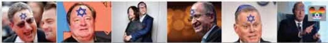
TOM ROTHMAN CEO SONY PICTURES ENT. BOB BAKISH CEO PARAMOUNT GLOBAL CHARLIE COLLIER CEO FOX ENTERTAINMENT BRIAN ROBERTS CEO COMCAST CORP. DAVID ZASLAV PRES. & CEO DISCOVERY, INC. BOB CHAPEK CEO THE WALT DISNEY CO.